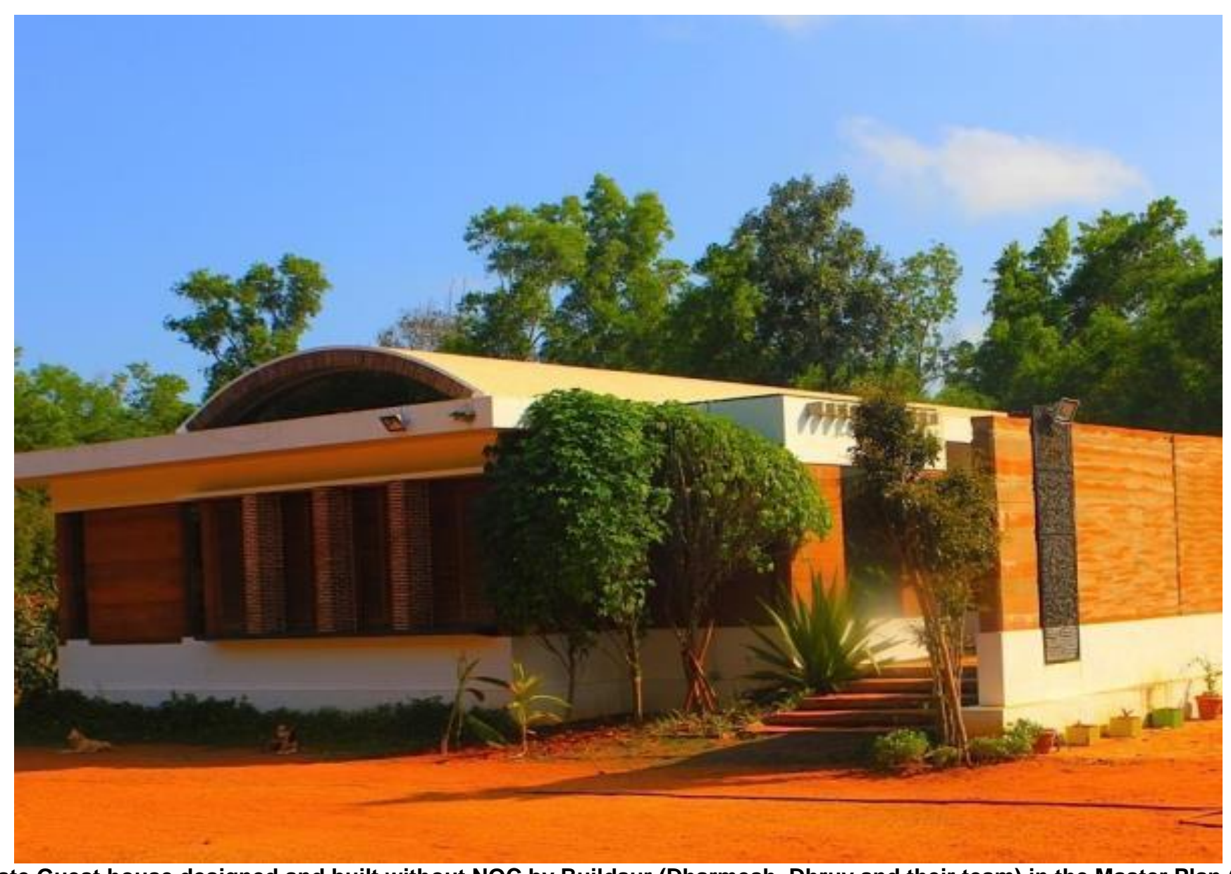
A private Guest house designed and built without NOC by Buildaur (Dharmesh, Dhruv and their team) in the Master Plan (GB)