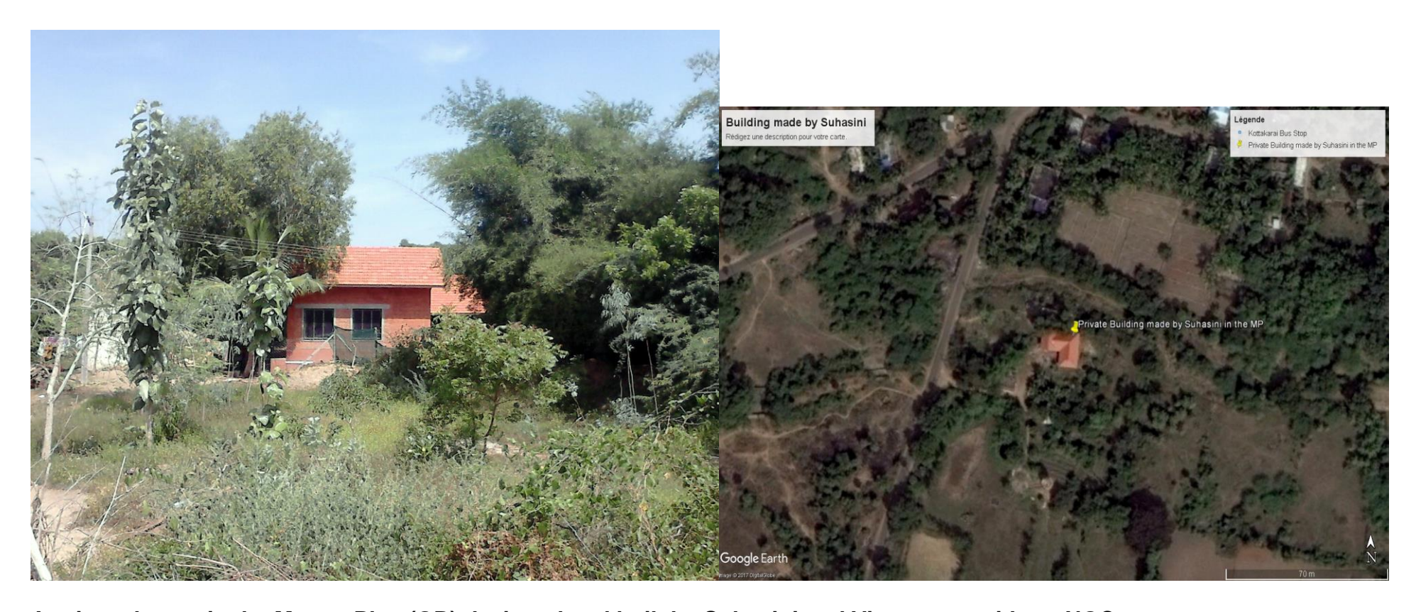
A private house in the Master Plan (GB) designed and built by Suhasini and Vinayagam without NOC.