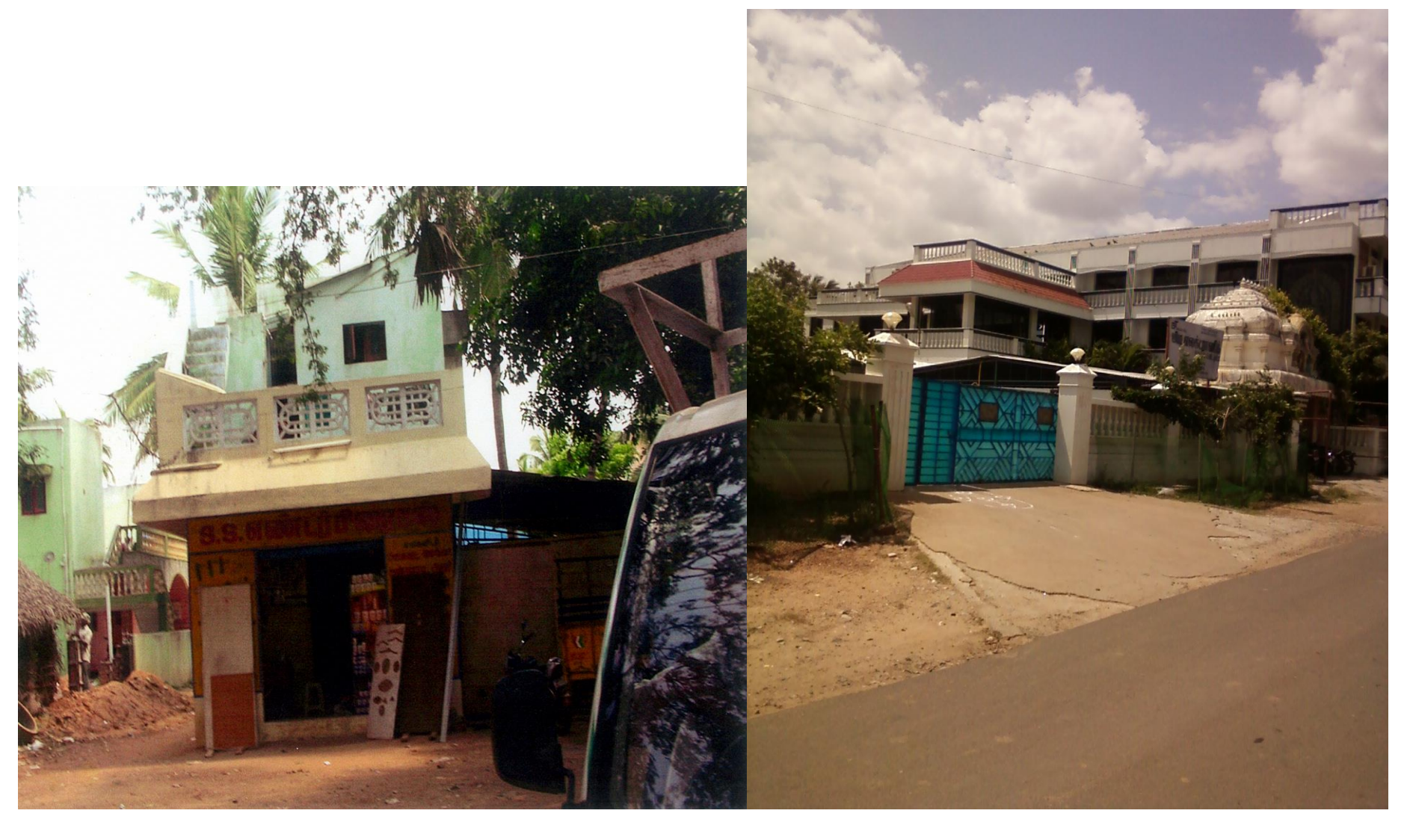
Dhanapal private building and Nursery Ramaligam former marriage hall in Kootroad: