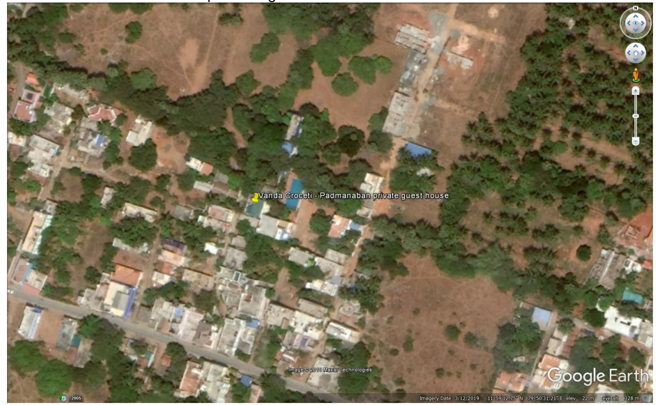
View of Padmanaban private guest house in Bharati Nagar (300 meters from Auromodel).

3 – In 2015 – Padmanaban acquire a large 2 floors House