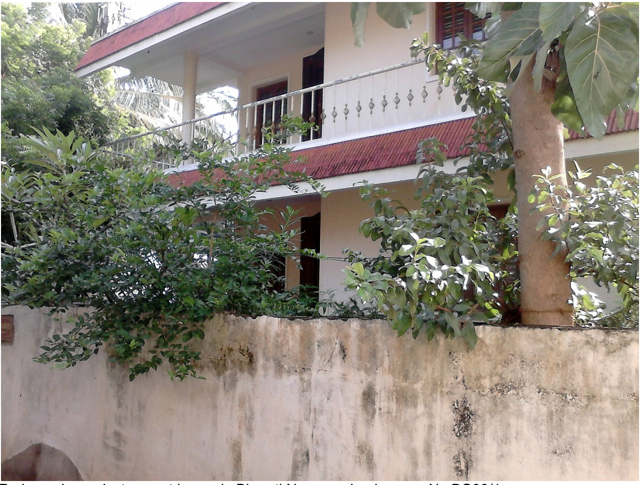
Padmanaban private guest house in Bharati Nagar on land survey No BO98/1.