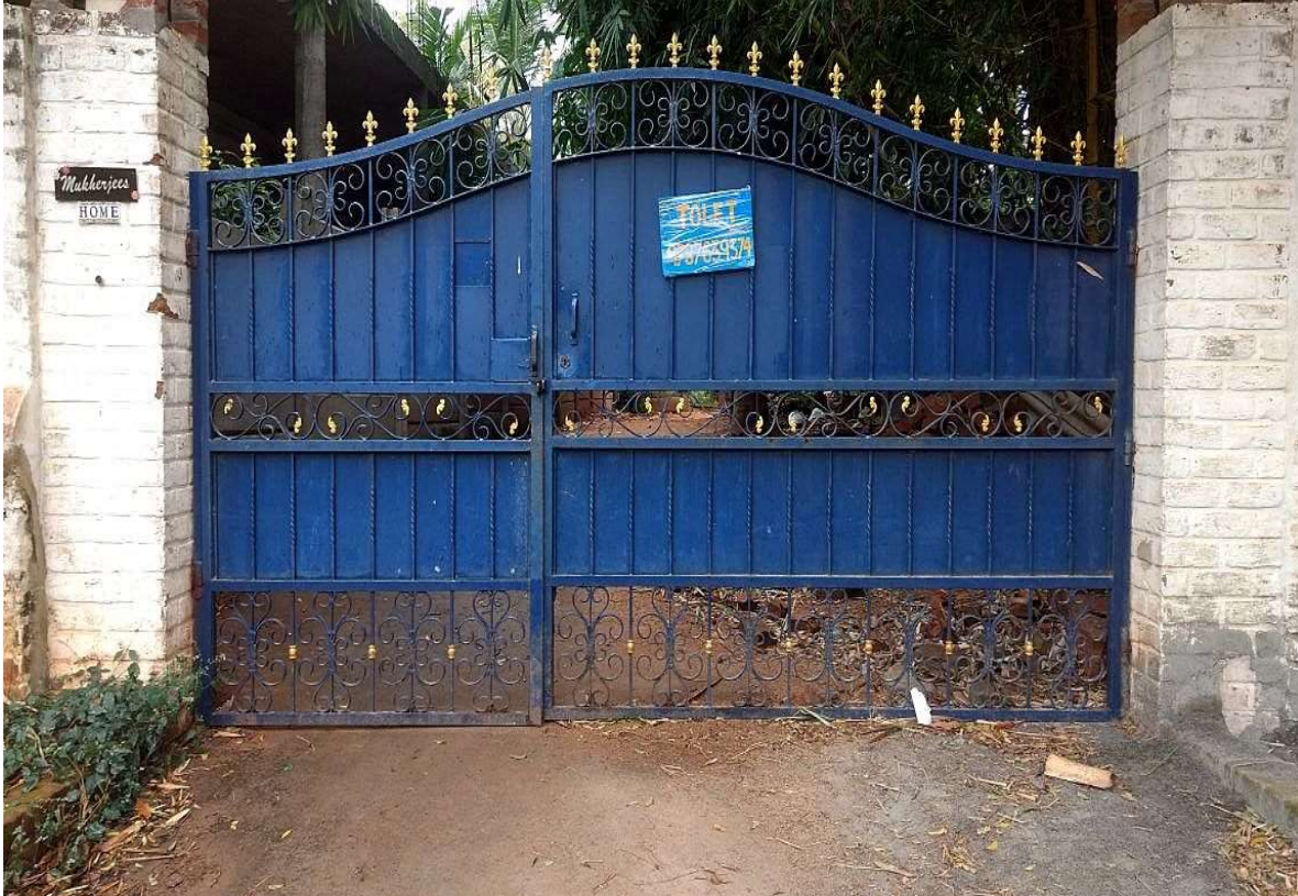
Gate of her house (as above):