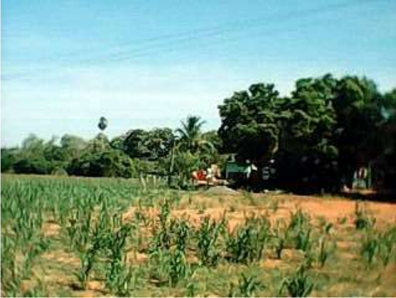
Kalya's land near Petai: