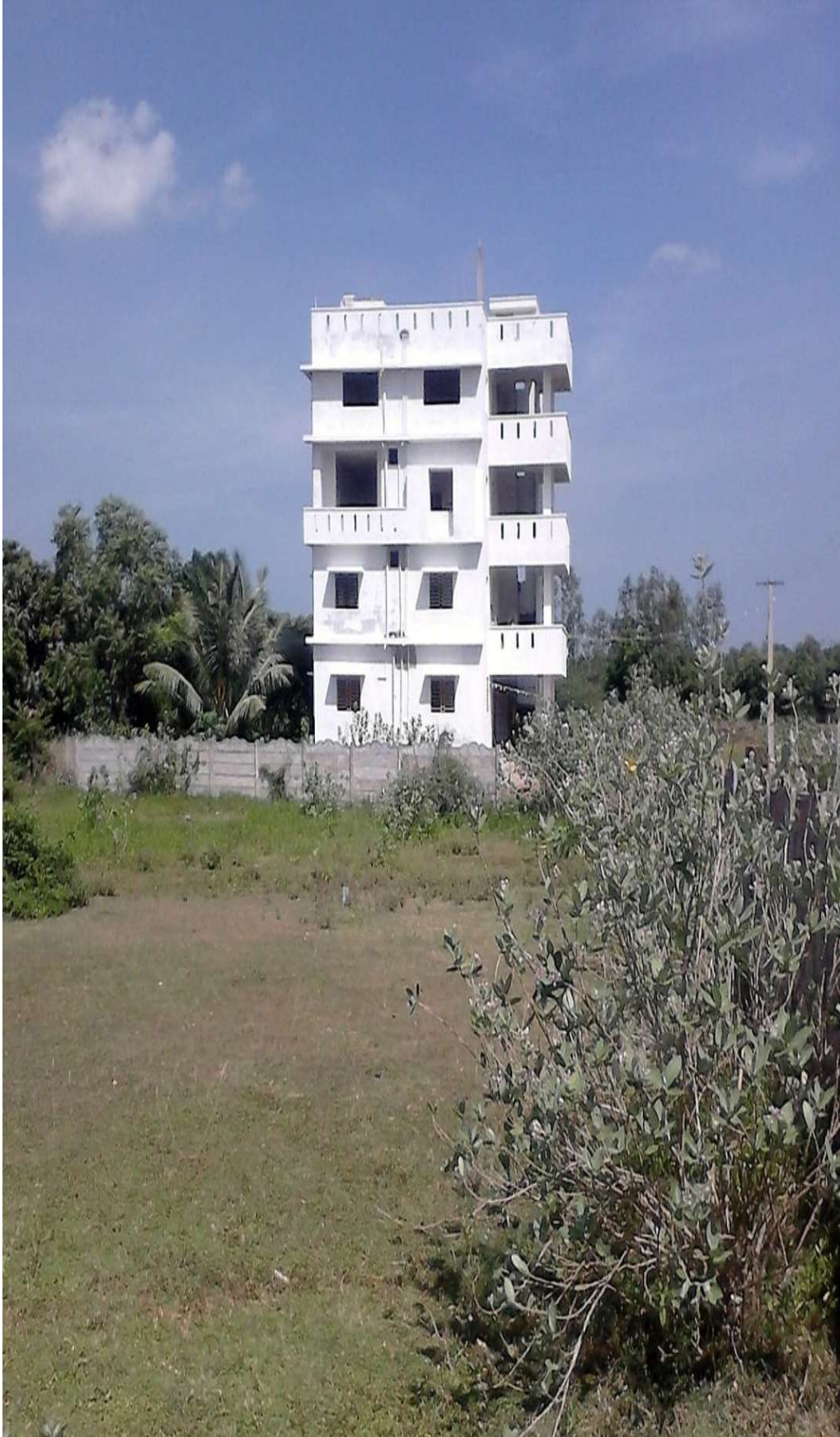
28 – Shiva (Matrimandir) - In the Master Plan area, adjacent to Ayarpadi Farm. Land survey IR 248/3= 3320 sf - in his wife name (Chelammal).