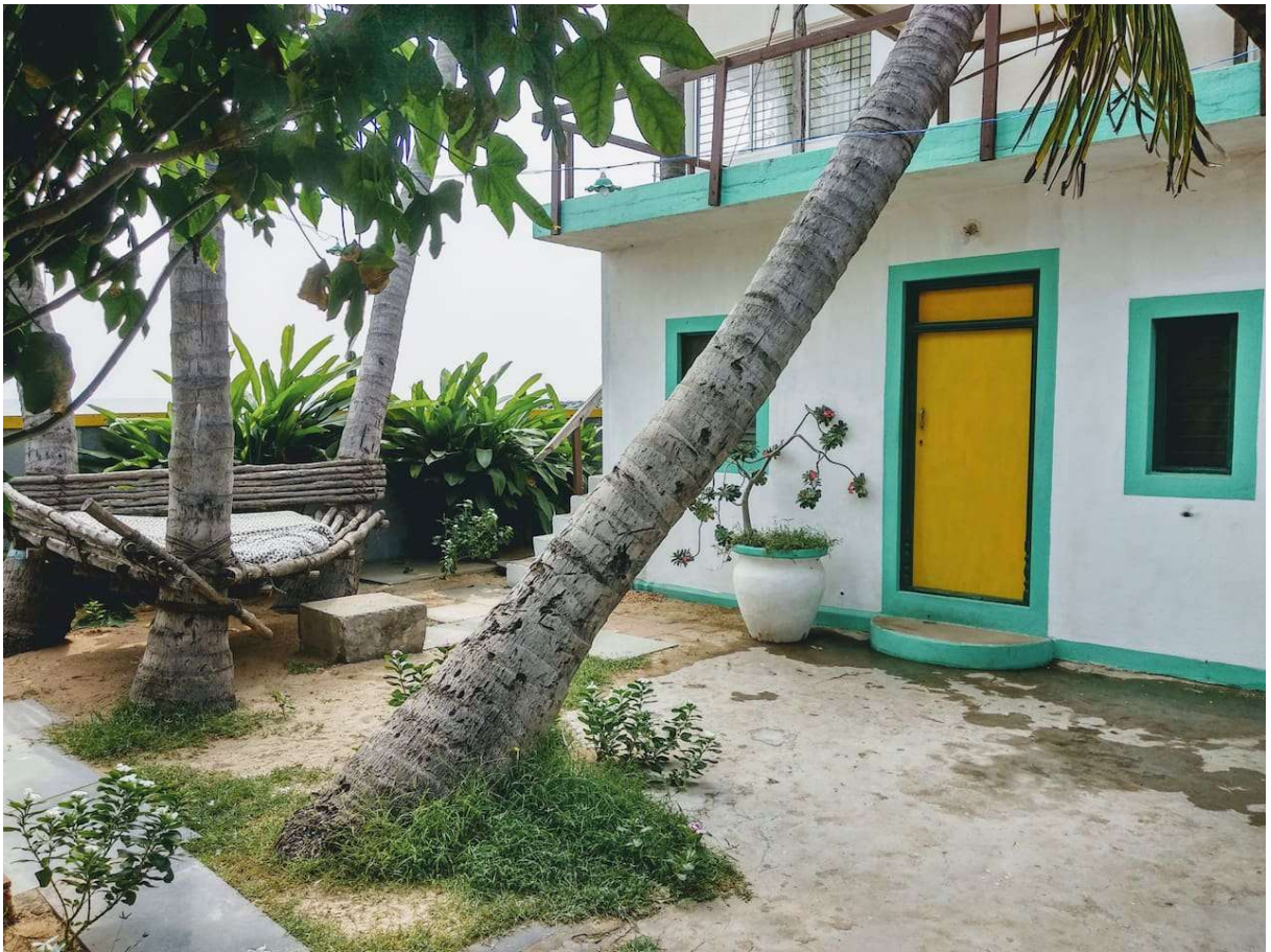
24, beach front Mariamman koil street, serenity beach, Thandirayankuppam, Puducherry, Tamil Nadu 605104 Téléphone : 099947 18647

https://www.airbnb.com/rooms/18696102?source_impression_id=p3_1585232163_CZ0DNtIDGLSb6RdU